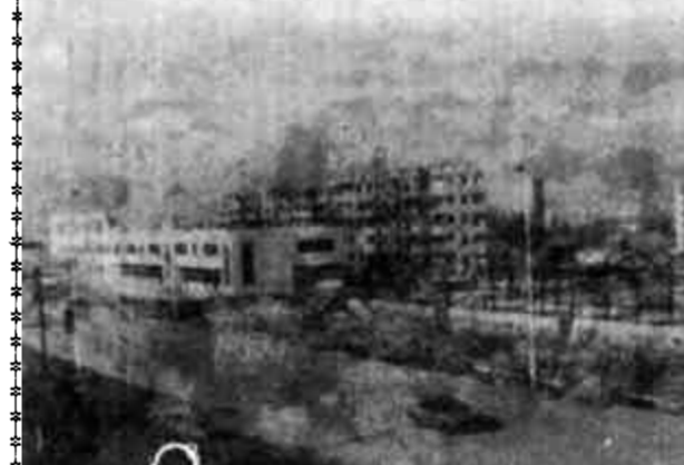
图为建设中的开发区一角。

本报讯 东营光明集团有限责任公司和垦利县石油化工厂，被认定为高新技术企业。东营光明集团有限责任公司和垦利县石油化工厂都是省科委认定的高新技术企业生产骨干企业，几年来，依靠科技进步，大力开发高新技术产品，企业的管理水平和产品的技术水平有了很大提高，高新技术产品产值率、科技投入和科技人员的比例都达到了高新技术企业的标准。东营光明集团有限责任公司先后承担各级各类科技项目7项，其中“Y211—150、Y241—115型封隔器”获省星火三等奖，九五集团公司产值将达到1.2亿元，利税1500万元。垦利县石油化工厂先后承担各级各类科技项目10项，其中“MAN石油助排剂”获省星火三等奖，“KSH浓缩酸系列产品开发”获省星火三等奖，被评为全市人均上缴利税最高企业。这两个企业被认定为高新技术企业，标志着我市企业的技术水平上了一个新台阶。（许廷青）