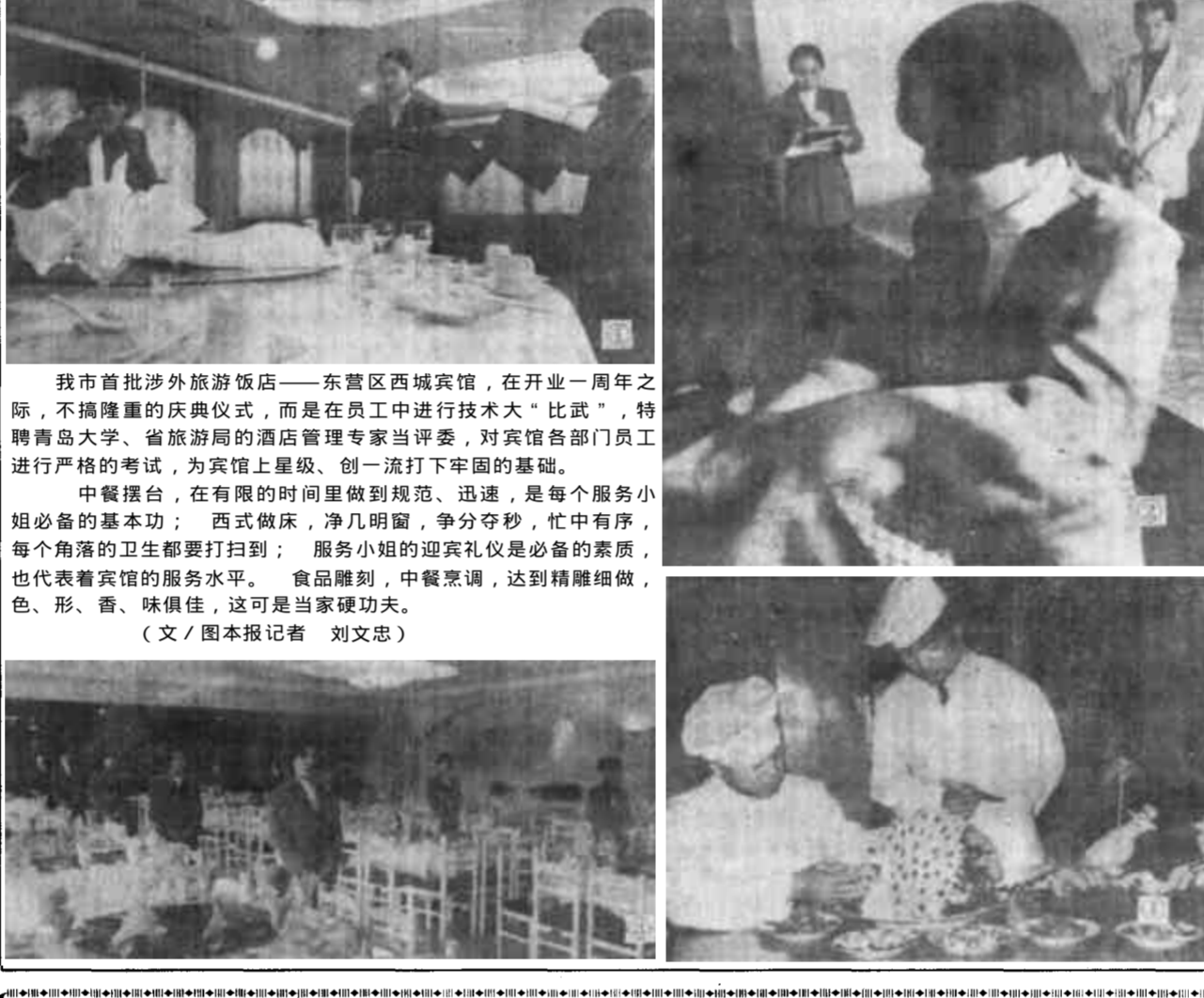
我市首批涉外旅游饭店——东营区西城宾馆，在开业一周年之际，不搞隆重的庆典仪式，而是在员工中进行技术大“比武”，特聘青岛大学、省旅游局的酒店管理专家当评委，对宾馆各部门员工进行严格的考试，为宾馆上星级、创一流打下牢固的基础。

中餐摆台，在有限的时间里做到规范、迅速，是每个服务小姐必须具备的基本功；西式做床，净几明窗，争分夺秒，忙中有序，每个角落的卫生都要打扫到；服务小姐的迎宾礼仪是必备的素质，也代表着宾馆的服务水平。食品雕刻，中餐烹调，达到精雕细做，色、形、香、味俱佳，这可是当家硬功夫。（文/图本报记者 刘文忠）