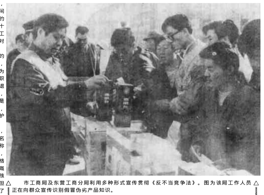
市工商局及东营工商分局利用多种形式宣传贯彻《反不正当竞争法》。图为该局工作人员正在向群众宣传识别假冒伪劣产品知识。

党十四届五中全会通过的《建议》在提出“把国有企业改革作为经济体制改革的中心环节”的同时提出：“要大力发展集体经济，鼓励和引导非公有制经济的发展。”《建议》提出了今后改革开放的主要任务，其中第一条就是：“坚持以公有制为主体、多种经济成分共同发展的方针，深化国有企业改革，建立现代企业制度。”党的十四届五中全会对非公有制经济地位的充分肯定，为非公有制经济的发展指明了方向，奠定了基础。作为承担非公有制经济代表人士思想政治工作的党委统战部来讲，应该抓住时机努力工作，积极引导非公有制经济健康发展。