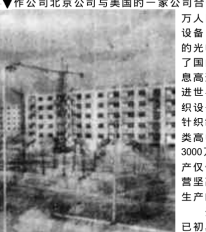
图为建设中的开发区一角。

弹指一挥，东营开发区已经走过了三年的创业历程；蓦然回首，我们发现开发区建设已初具规模，成为全市对外开放的“窗口”。 1992年12月28日，经山东省人民政府批准，东营开发区正式设立了，这是黄河三角洲综合开发进入实质性阶段的一个里程碑。 开发区走什么路子？市委、市政府根据国务院对经济开发区“以工业为主，以外向型为主，以经济效益为主”的要求，根据东营的实际情况，确定了“高起点、高标准、快起步、起好步”的发展思路。东营开发区抢抓机遇，开拓进取，迎难而上，开始了艰难创业的历程。 东营开发区位于东西城以南的近郊区，分控制区、规划区与起步区三个层次；规划面积14平方公里，辟设了综合园、工业园和精细化工园三个专业园区。三个园区分别采取不同开发模式，精细化工园由油田投资开发，工业园以大项目带动开发，综合园由政府投入启动开发。三年来三个园区完成2亿元的基础配套设施工程，完成开发配套土地面积150多万平方米，“六通一平”配套工程框架已经形成，项目进区建设的条件已经具备，一批进区项目已经开工建设，有的已经建成投产。同时，精简办事机构，简化办事程序，转变工作职能，实行了“简化、高效、快捷”的办事制度。这样，开发区的软硬环境都得到了大大改善。